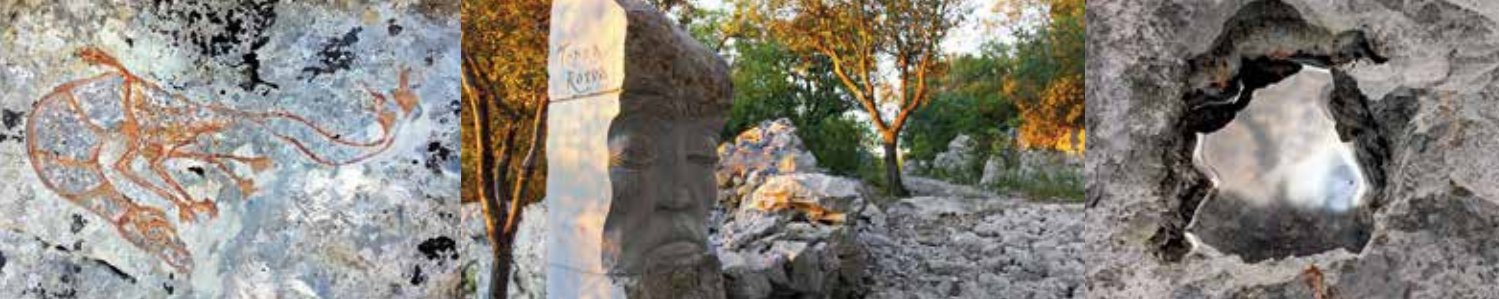
Une "crevette de pierre" dans une mer de roches...